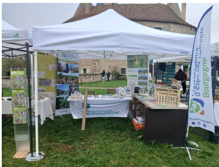
Figure 8 : affiche de l'édition 2024 de Festi'grues et Stand CEN Bourgogne 2025