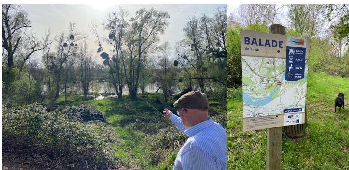
Figure 3 : Photos des Visite élus pour les projets de valorisation de la Loire à Imphy (gauche) et Sougy-sur-Loire (droite)