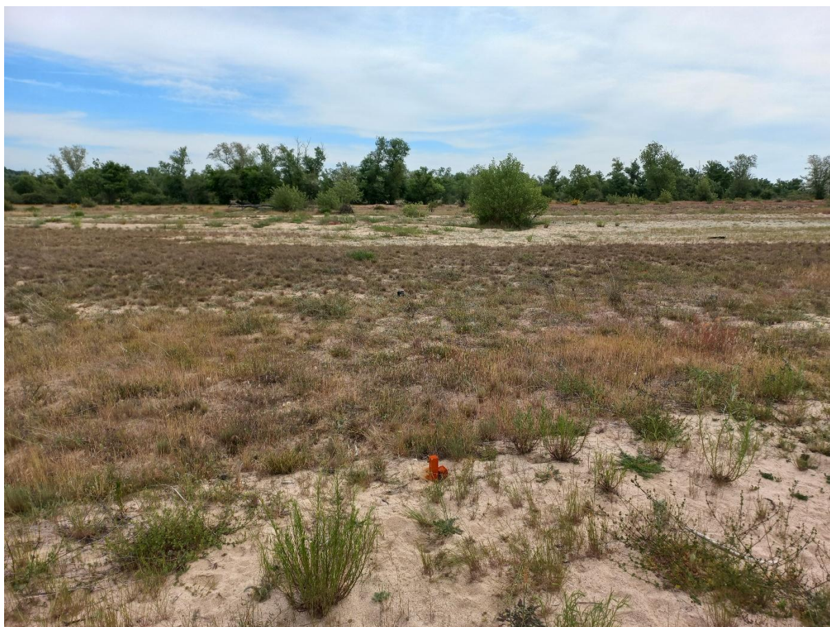
Figure 4 : photo d'une pelouse ligérienne suivie

Dans ce contexte, le Conservatoire d'espaces naturels de Bourgogne, animateur du site depuis 2011, a créé une méthode d'évaluation de l'état de conservation des pelouses ligériennes. Cette méthode a pour but de mesurer l'évolution de ces milieux dans le temps, et ainsi d'évaluer la pertinence des modalités de gestion, notamment pastorales, mises en œuvre. Elle a fait l'objet de la rédaction d'un cahier technique méthodologique en 2019.