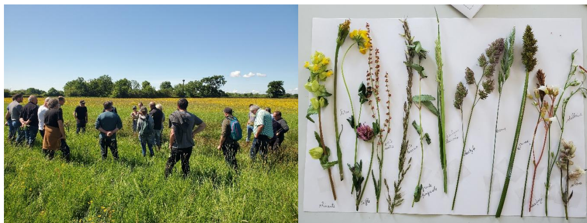
Figure 1 : Photos de la formation "Que disent les plantes de ma parcelle ?"

« Restaurer ses prairies permanentes grâce aux semences locales ? » 17 juin 2025