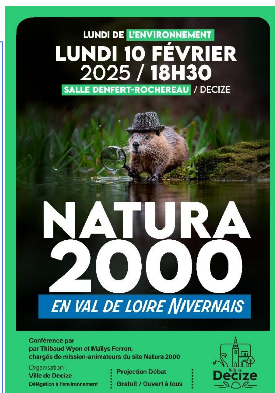
Figure 6 : Illustration de l'article du JDC du 19/02/2025 et affiche de l'évènement réalisé par la commune de Decize

Article du Journal du Centre du 19/02 suite à l'intervention au Lundis de l'Environnement de Decize